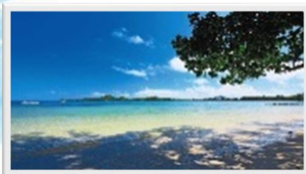
①底地(すくじ)ビーチ